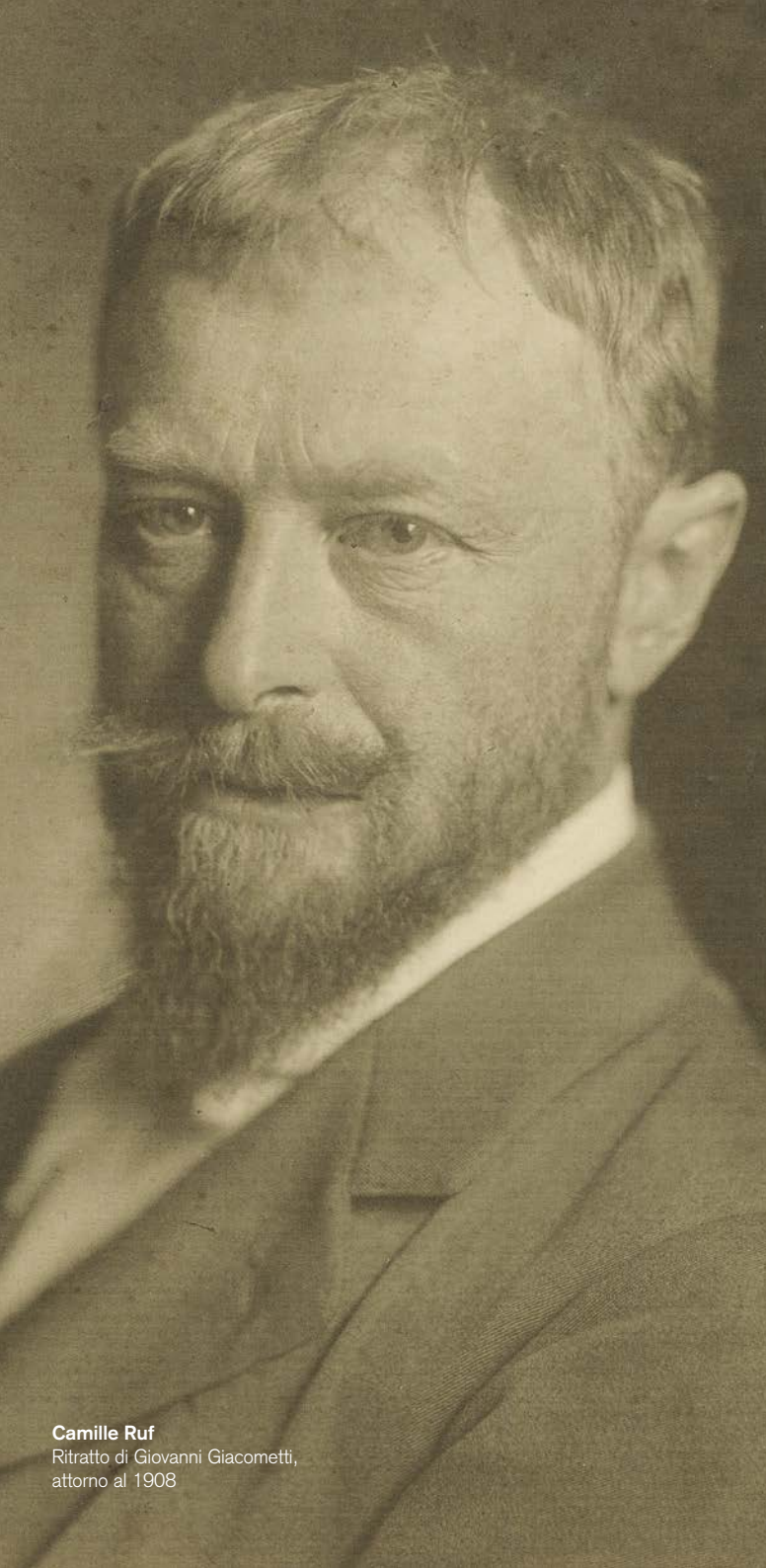
Camille Ruf Ritratto di Giovanni Giacometti, attorno al 1908